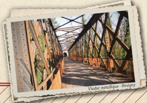
Viaduc métallique - Revigny

P Galerie du Faîte - Revigny Coordonnées GPS 5°37'06.11"E / 46°38'30.33"N