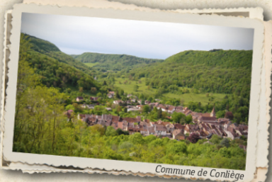
Commune de Conliège

P Chemin du Mont - Conliège Coordonnées GPS 5°36'46.6"E / 46°39'17.8"N