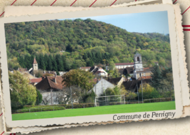
Commune de Perrigny