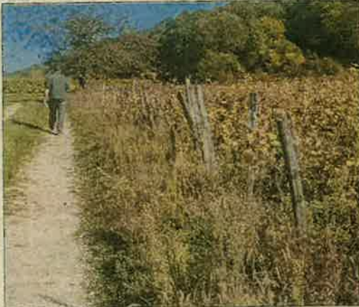
Pas moins de 45 viticulteurs ont d'ores et déjà répondu présent pour aider aux travaux de taille de la vigne.

C'est une tradition ancestrale chez les viticulteurs. Lorsqu'il y a des souffrances chez un ou plusieurs membres de la profession, quelles qu'elles soient, un élan de solidarité se met rapidement en place pour donner un bon coup de main. C'est ce qui va se passer, vendredi 3 mars, au domaine du château de l'Étoile.